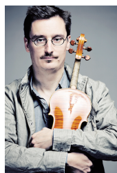
マーク・ゴトーニ